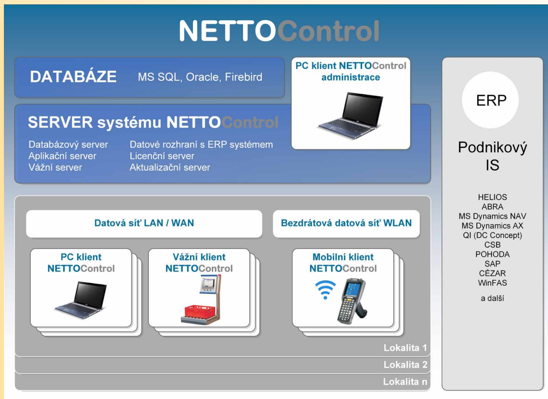
Schéma infrastruktury systému NETTOControl